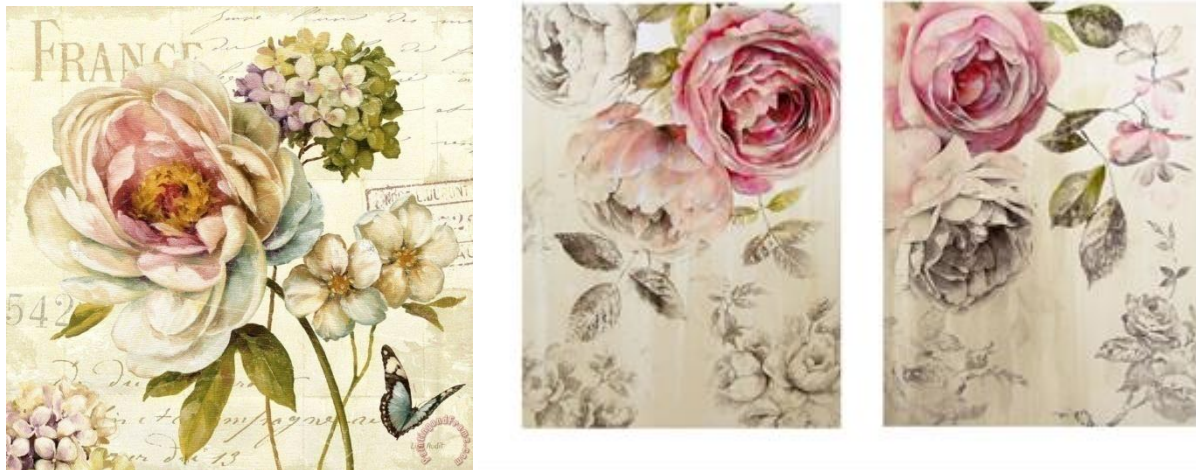
Рисунок 1. Выбор стиливого орнамента в стиле Прованс для эскиза.

Задание 1. Выполнить эскиз дизайн элемента интерьера или предмета быта в заданных стилевых направлениях.