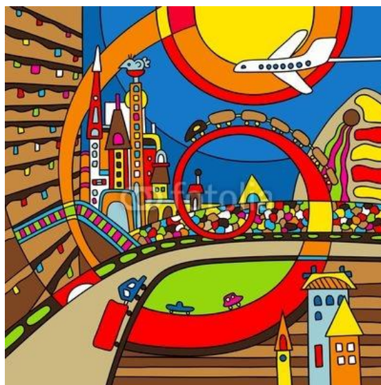
Рисунок 3. Цветовой эскиз настенного панно в стиле Поп –арт.