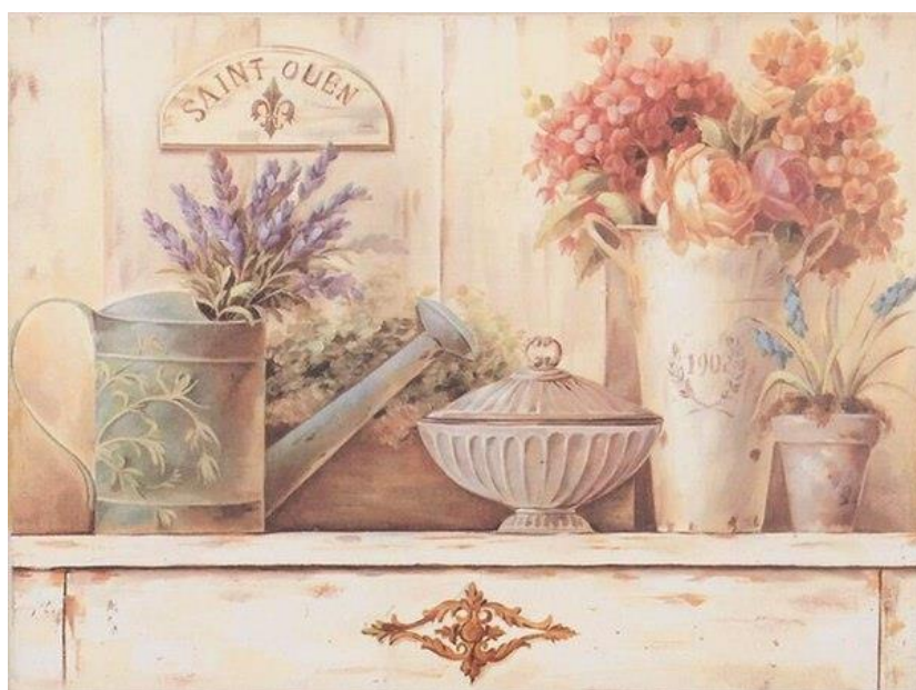
Рисунок 2. Эскиз панно в стиле Прованс

Задание 2. Выполнить художественный или фотоколлаж с применением стиливого направления в «Стили времени», Формат А-2.